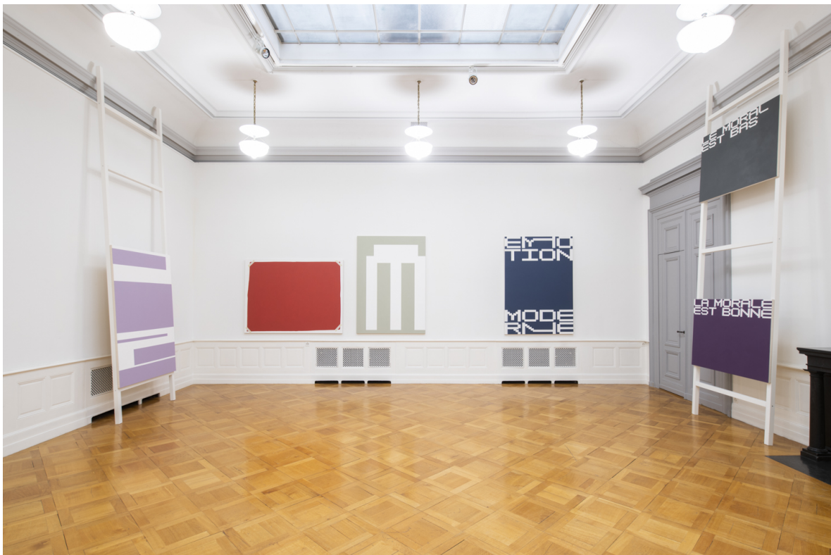
Vue de l'exposition « Plus que ça » de Arnaud Sancosme à la Salle Crosnier - Palais de l'Athénée, visible jusqu'au 18.02.23.