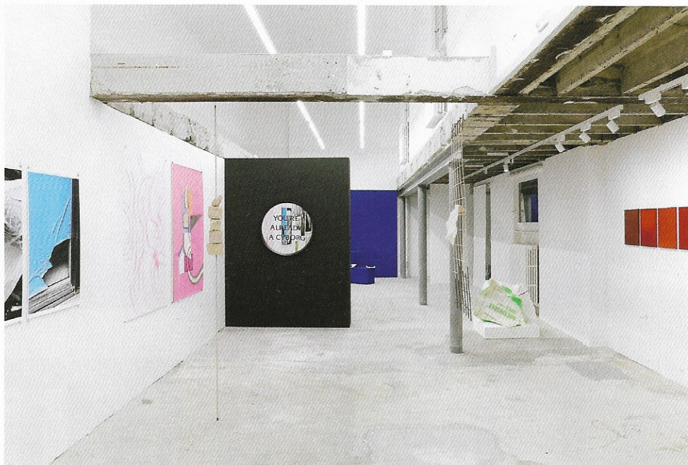
Galerie Fabienne Levy, Space Invasion, 2020